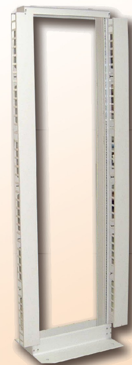
開放型儀器組合架